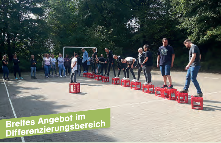
Breites Angebot im Differenzierungsbereich