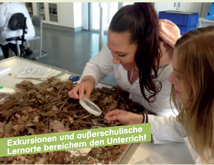
Exkursionen und außerschulische Lernorte bereichern den Unterricht